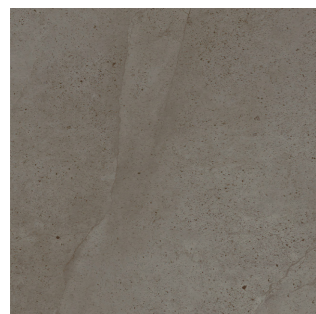
クリップ ALA-30-14(300角) ALA-30K-14(300角 階段)