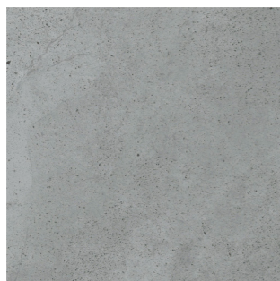
クリップ ALA-30-16(300角) ALA-30K-16(300角 階段)