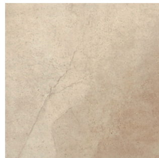
クリップ ALA-30-4(300角) ALA-30K-4(300角 階段)