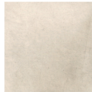
クリップ ALA-30-11(300角) ALA-30K-11(300角 階段)