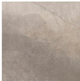
クリップ ALA-30-7(300角) ALA-30K-7(300角 階段)