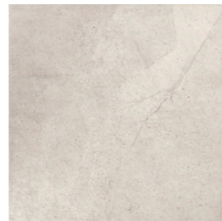
クリップ ALA-30-8(300角) ALA-30K-8(300角 階段)