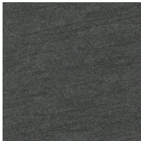
BST-60-5(600角) グリップ / BST-36-5(300×600角) グリップ BS-60-5M(600角) マット / BS-36-5M(300×600角) マット