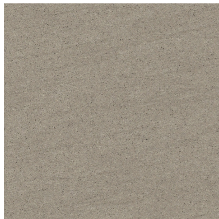
BST-60-8(600角) グリップ / BST-36-8(300×600角) グリップ BS-60-8M(600角) マット / BS-36-8M(300×600角) マット