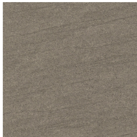
BST-60-6(600角) グリップ / BST-36-6(300×600角) グリップ BS-60-6M(600角) マット / BS-36-6M(300×600角) マット