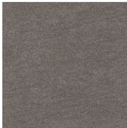
BST-60-9(600角) グリップ / BST-36-9(300×600角) グリップ BS-60-9M(600角) マット / BS-36-9M(300×600角) マット