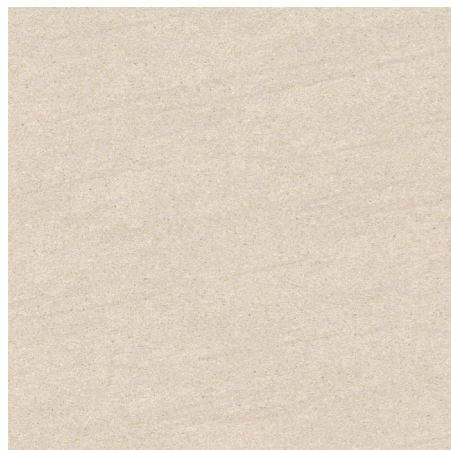
BST-60-1(600角) グリップ / BST-36-1(300×600角) グリップ BS-60-1M(600角) マット / BS-36-1M(300×600角) マット