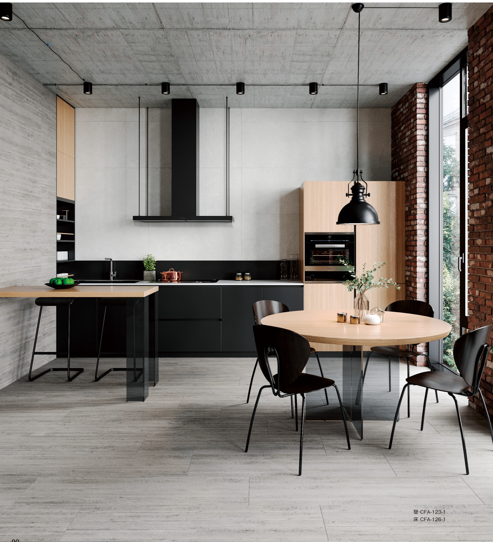
壁 CFA-123-1 床 CFA-126-1

洗練された色目の杉板目コンクリート打ち放し調タイル。照明を受けて浮かび上がる木目ならではの表情は、味わいのある素朴な風合いを空間にもたらし、程よいぬくもりをプラスしてくれます。