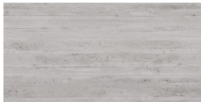
ラフ (2023年11月以降入荷予定) CFA-126-1 (600×1200角) / CFA-123-1 (300×1200角)