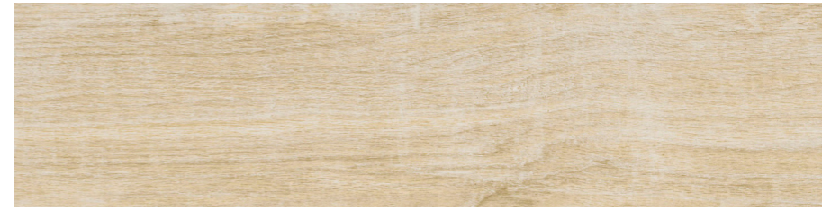
ハニー ラフ COT-156-2