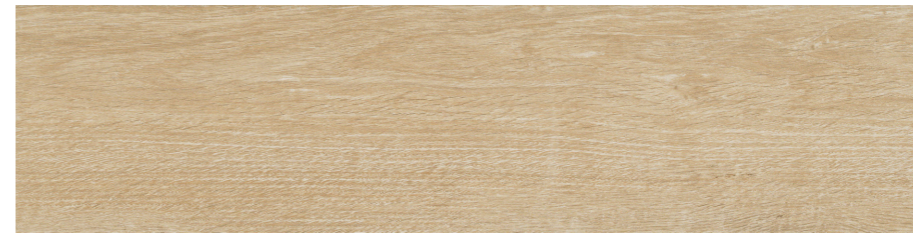
ベージュ ラフ COT-156-3