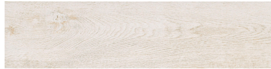
ホワイト ラフ COT-156-1