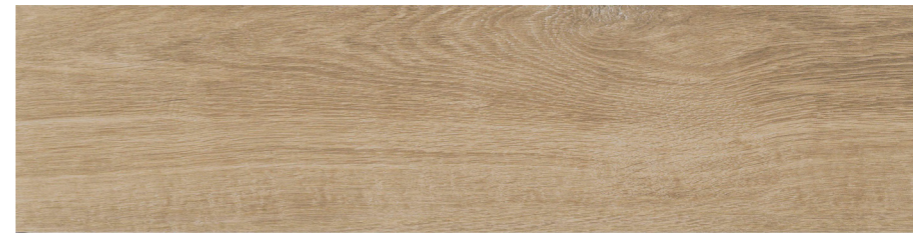
ブラウン ラフ COT-156-4