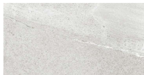
シルバークオーツ DV-12-21Q