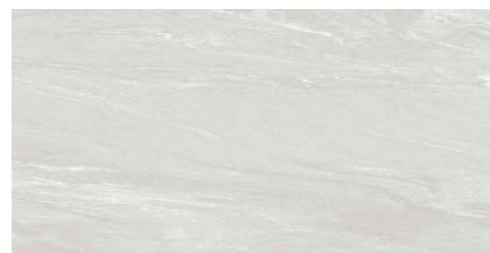
ライトグレー DVS-12-6 / DV-12-6M