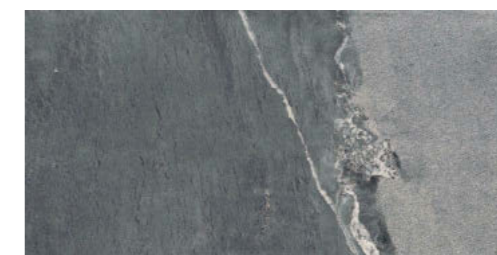
ダークスレート DV-12-58Q ※意匠上、脈模様やサビ模様が含まれるものもあります。