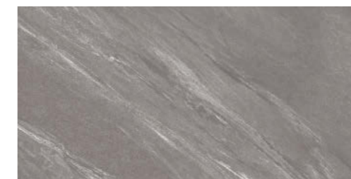
チャコール DVS-12-8 / DV-12-8M