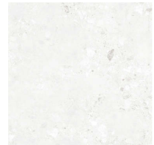
チェッポホワイト OLP-12-14