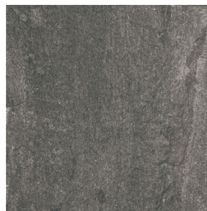
ブラック クリップ UMQ-60-4 (600角) / UMQ-36-4 (300×600角)