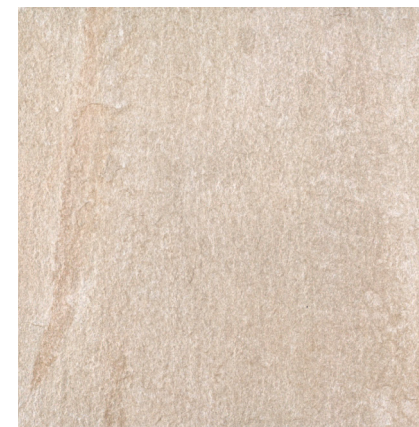
ベージュ クリップ UMQ-60-2 (600角) / UMQ-36-2 (300×600角)