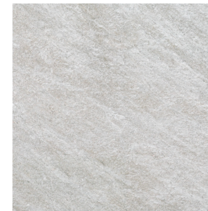
ライトグレー クリップ UMQ-60-3 (600角) / UMQ-36-3 (300×600角)