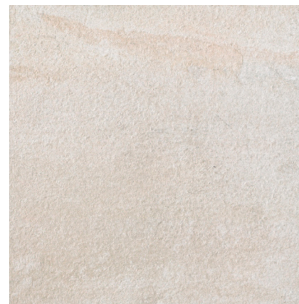
ホワイト クリップ UMQ-60-1 (600角) / UMQ-36-1 (300×600角)