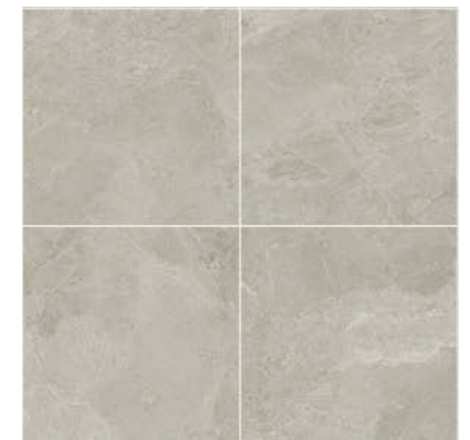
VEL-60-7 (600角 4枚並べ)