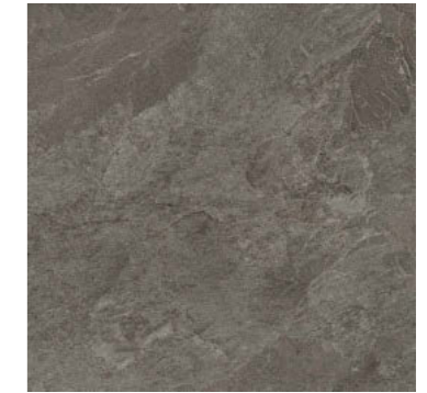
コーク VEL-60-9 / VE-60-9M