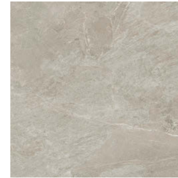
シルバー VEL-60-7 / VE-60-7M