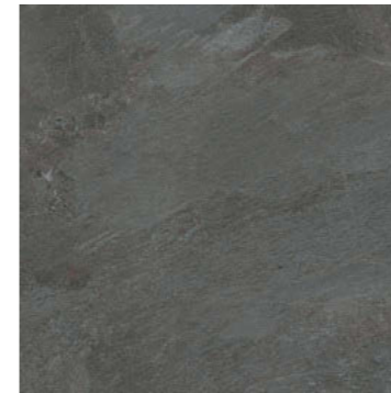
ブラック VEL-60-10 / VE-60-10M