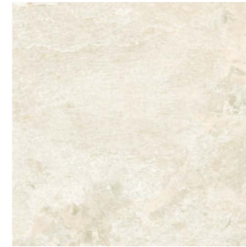
デザート VEL-60-2 / VE-60-2M