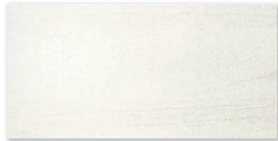
ハニーミルク [ 半磨 ] PC-36-417(300×600)