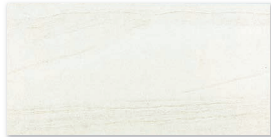
ハニーミルク [ ラフ(石面) ] C-36-417(300×600)