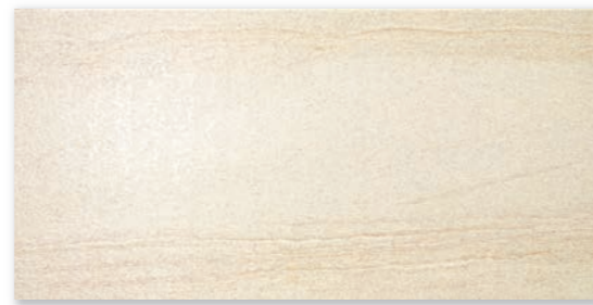
モカ [ 半磨 ] PC-36-437(300×600)