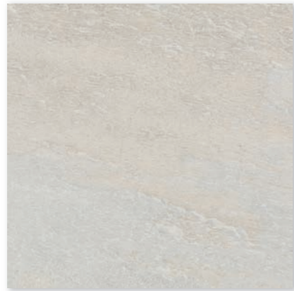
ホワイト [ ラフグリップ ] JQT-60-1 (600×600) JQT-36-1 (300×600)