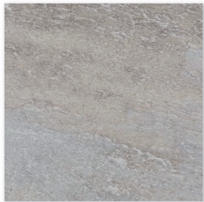
グレー [ ラフグリップ ] JQT-60-3 (600×600) JQT-36-3 (300×600)