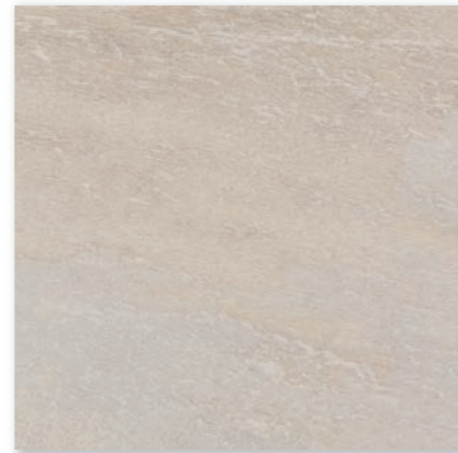
ベージュ [ ラフグリップ ] JQT-60-2 (600×600) JQT-36-2 (300×600)