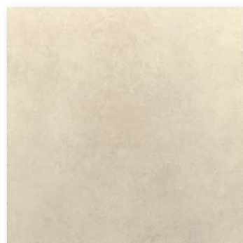
NYK-60-1(600×600) [ グリップ ] NY-60-1M(600×600) [ マット ] NYK-36-1(300×600) [ グリップ ] NY-36-1M(300×600) [ マット ]