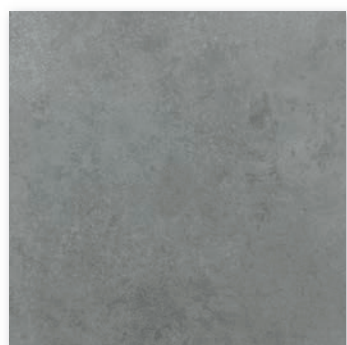
NYK-60-4(600×600) [ グリップ ] NY-60-4M(600×600) [ マット ] NYK-36-4(300×600) [ グリップ ] NY-36-4M(300×600) [ マット ]