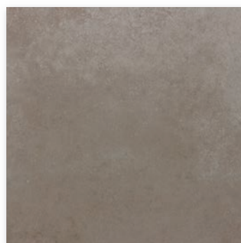
NYK-60-3(600×600) [ グリップ ] NY-60-3M(600×600) [ マット ] NYK-36-3(300×600) [ グリップ ] NY-36-3M(300×600) [ マット ]