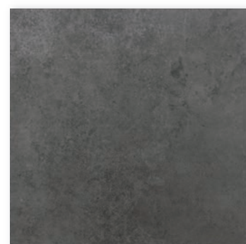
NYK-60-5(600×600) [ グリップ ] NY-60-5M(600×600) [ マット ] NYK-36-5(300×600) [ グリップ ] NY-36-5M(300×600) [ マット ]