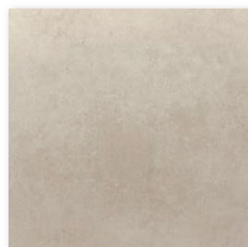
NYK-60-2(600×600) [ グリップ ] NY-60-2M(600×600) [ マット ] NYK-36-2(300×600) [ グリップ ] NY-36-2M(300×600) [ マット ]