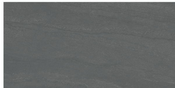
SOG-12-5 (600×1200) [ ラフ ] SO-12-5M (600×1200) [ マット ]