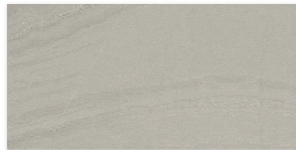
SOG-12-3 (600×1200) [ ラフ ] SO-12-3M (600×1200) [ マット ]