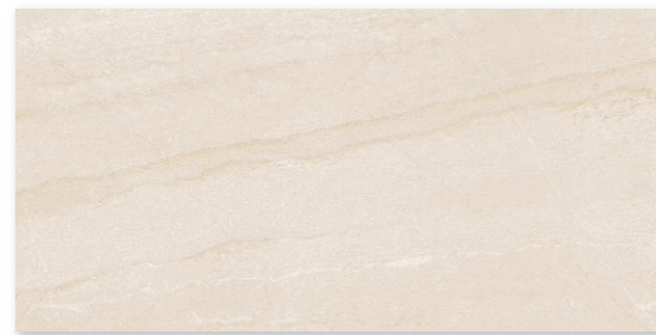
SOG-12-1 (600×1200) [ ラフ ] SO-12-1M (600×1200) [ マット ]